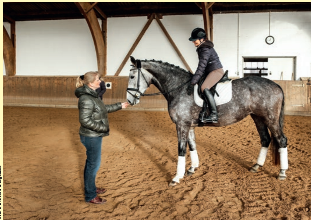
Beim Probereiten kann der Interessent das Pferd, das zum Verkauf steht, testen – unter dem Sattel, aber auch im Umgang und der Pflege. Stimmt die Chemie? Fühlen sich beide wohl?