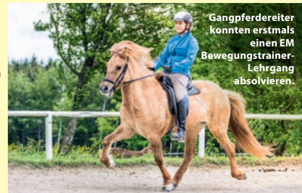
Gangpferdereiter konnten erstmals einen EM Bewegungstrainer-Lehrgang absolvieren.