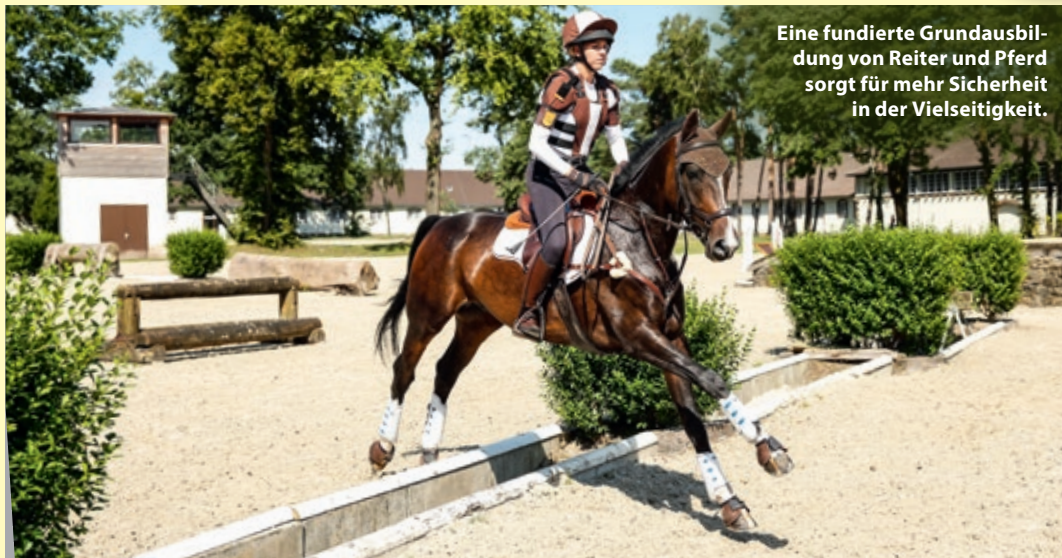
Eine fundierte Grundausbildung von Reiter und Pferd sorgt für mehr Sicherheit in der Vielseitigkeit.