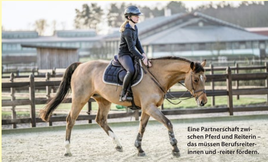
Eine Partnerschaft zwischen Pferd und Reiterin – das müssen Berufsreiterinnen und -reiter fördern.