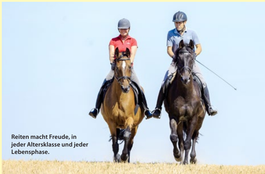
Reiten macht Freude, in jeder Altersklasse und jeder Lebensphase.