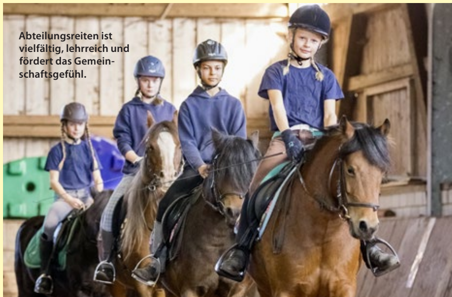
Abteilungsreiten ist vielfältig, lehrreich und fördert das Gemeinschaftsgefühl.